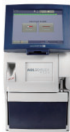
血液ガス分析装置 ABL 90 FLEX PLUS